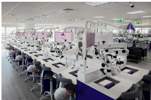
Table de formation avec 24 sièges, moniteurs, kits de formation FKG, moteur endodontique et localisateur d'apex, microscopes Labomed, têtes fantômes, lampes LED chirurgicales, tabourets dentaires