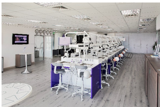
Table de formation et vue du centre

Table de formation avec 24 sièges, moniteurs, kits de formation FKG, moteur endodontique et localisateur d'apex, microscopes Labomed, têtes fantômes, lampes LED chirurgicales, tabourets dentaires