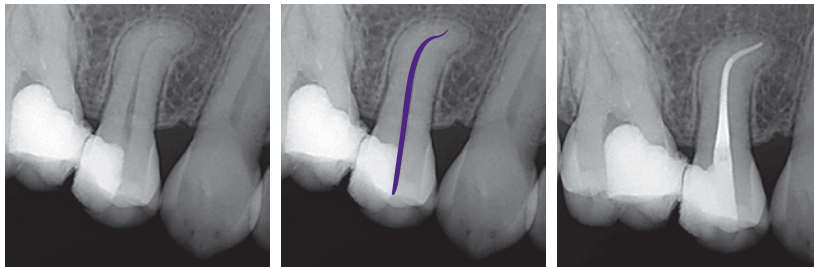
Pre-op Diagnosis: Pulpitis