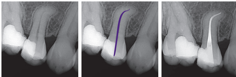
Pre-op Diagnosis: Pulpitis