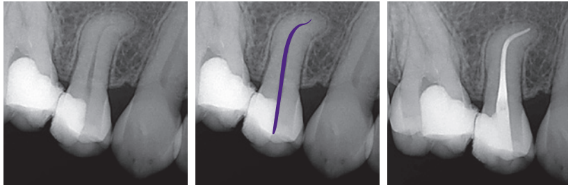
Pré-opératoire Diagnostic : pulpite